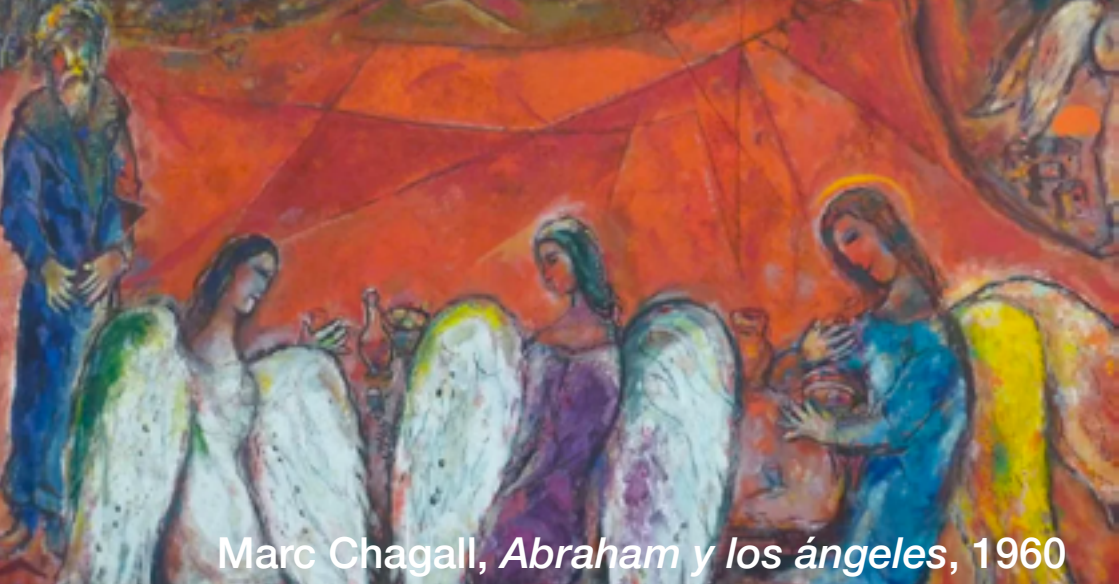
Marc Chagall, Abraham y los ángeles , 1960